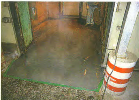
低温でも固まるため冷凍倉庫内でも施工可能(写真は冷凍倉庫出入り口・施工後)