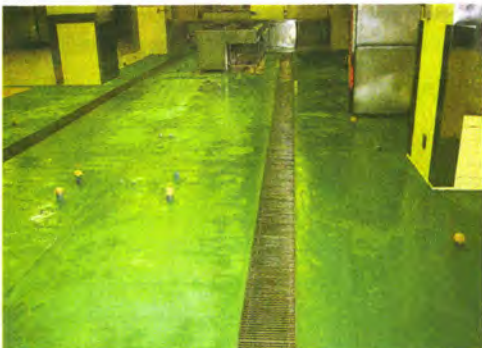
食品加工場、ホテルの厨房でも採用実績多数(着色もできる)

「ペイブメント」シリーズ新発売の「FR」は気温15度の環境下で約15分は無害無臭で固まり、低温(室温)マイナス25度までの心配がなく、低温でも短時間で固まるため、冷凍・冷蔵倉庫や冬期の食品関連施設の補修に最も適した。冷たい床に水を加えて、冷たい床を柔らかくし、食品関連施設の補修に最も適した。冷たい床に水を加えて、冷たい床を柔らかくし、食品関連施設の補修に最も適した。冷たい床に水を加えて、冷たい床を柔らかくし、食品関連施設の補修に最も適した。